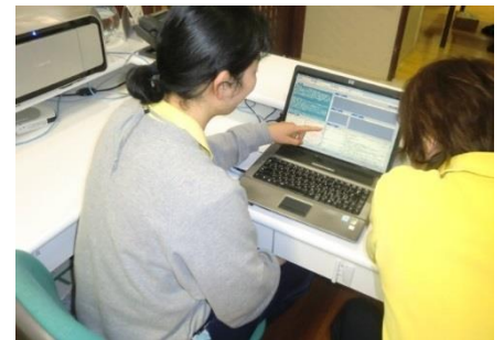
ネットワークを活用した情報共有