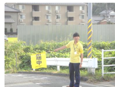
防犯パトロール／通学の見守り