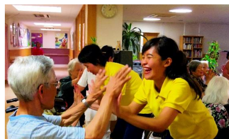
EPA候補者の職場での様子