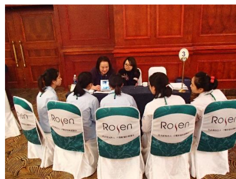
ベトナム・ハノイでの説明会

当法人も優秀な人材の育成のためにいち早くインドネシアやベトナムの現地に赴き、候補者との面談をしています。