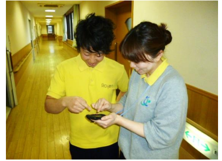
iPodでの入力（高齢・障害）

介護者の腰痛予防の観点から、最新の機器を導入し、ケアスタッフの腰痛予防に努めています。