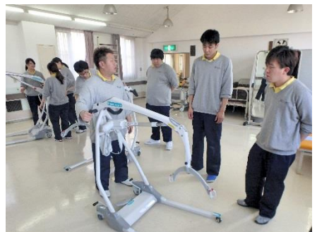
障害者支援施設 誠光園での腰痛予防対策（室内移乗用リフト）