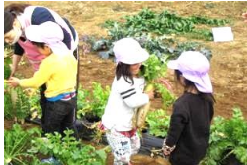
園庭横の畑で収穫祭