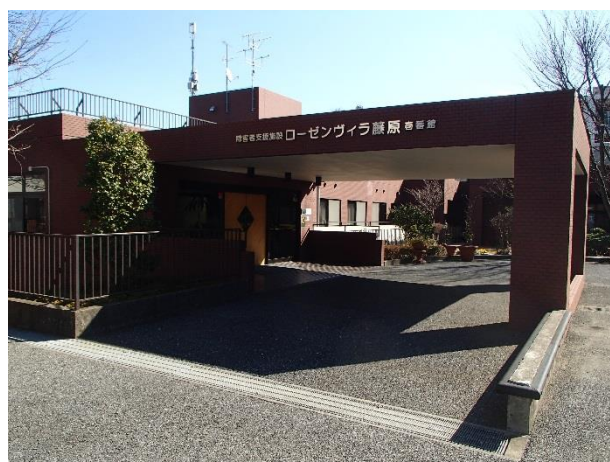
地域のために障害・高齢分野の複合的福祉エリアにある障害者施設です。地域の方をお招きしたイベントを積極的に取り入れたオープンな施設です。