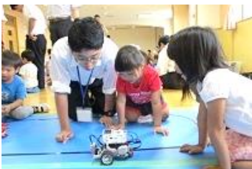
工業高校からロボットと遊ぼう！