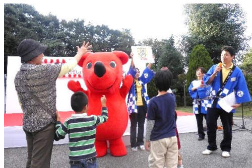
地域参加型「ローズまつり」