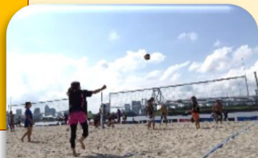
休日はアクティブに！