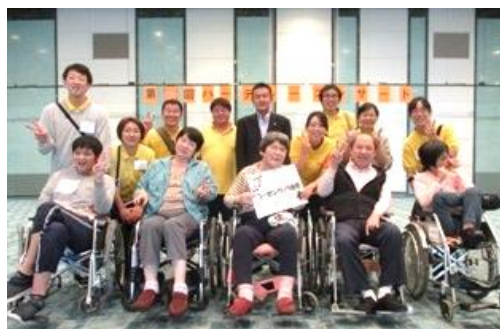
ハーティーコンサート