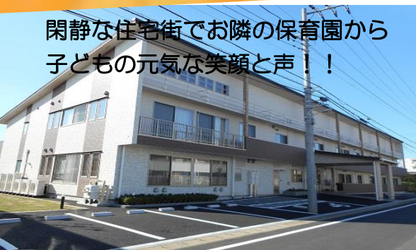
閑静な住宅街でお隣の保育園から 子どもの元気な笑顔と声!!