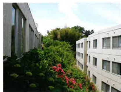
渡り廊下から望む施設の外観