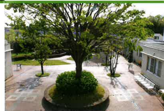
憩いの場の中庭(出会いの広場)