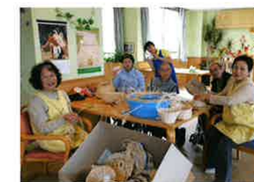
ボランティアさんと藤工芸