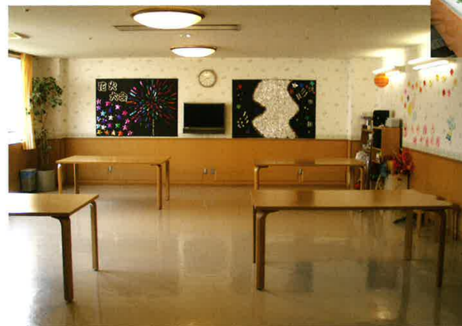
新館1F ひまわりリビング