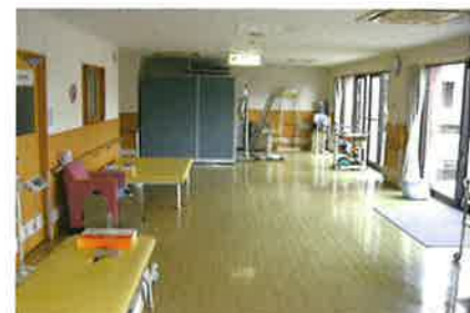
リハビリ機器を取り揃えたリハビリコーナー

在宅で介護されている家族等の休息やご用事の際に、短期間ご利用いただけるサービスです。ご家族などが旅行や介護疲れなどで介護を行えない時など、一時的に施設をご利用いただけます。お住まいの市町村から福祉サービスの支給決定を受けた方がご利用いただけます。