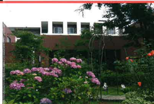
目に飛び込んでくる鮮やかなエントランスの様子